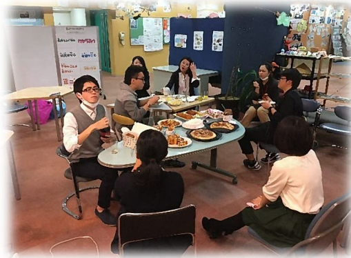
「わかものたまりば」に集まる若者たち 仲間とあつまって、ほっと語り合えるひとときです。