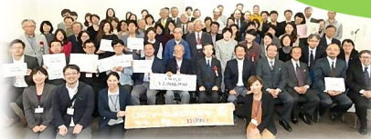
写真上) CSO アワード授賞式の様子 写真下) 事業評価会の様子

2016年11月、大阪NPOセンター主催の「CSO フォーラムおおさか2016」にて「CSO アワード2016」の授賞式が行われました。当協会の「日本語交流活動」は大賞に次ぐ「CSO 賞」を受賞しました。CSO アワードは、市民の自発的・公共的な活動により社会変革をめざす市民社会組織を対象として毎年実施されています。