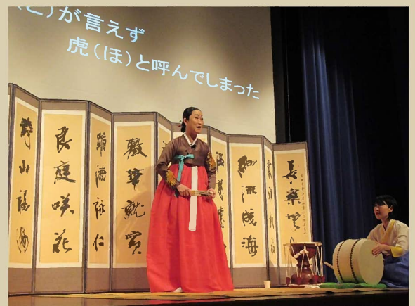
スクリーンには歌の内容の字幕を映し出しています