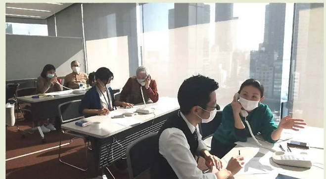
離婚電話相談ホットラインの会場にて