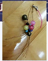
樹木の繊維を使って ストラップが完成!

MinaMinaの会(アイヌ民族の文化・伝統・歴史・人権をわかりやすく伝える会)のお二人を講師にお招きし、アイヌ紋様スタンプを押してオリジナルのハンカチやエコバックを作成。樹皮を加工した繊維を編んで、ストラップ作りも行いました。アイヌ語の挨拶や手遊びを教えていただき、昔話アニメも観て、子どもたちはアイヌ民族の文化の一端に触れ、楽しく貴重な体験ができたようです。