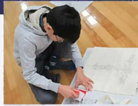
アイヌ紋様のスタンプで オリジナルのエコバック作り