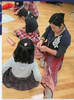
講師と一緒に ストラップ作り