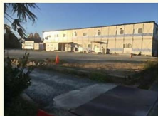
ここには、造り酒屋があったはずでした。

「いつも歩いているのはお年寄りばかりだから。若い人が歩いているのは珍しいから、何事かと思って、声をかけちゃったよ。」お巡りさんはそう言いました。記憶を辿りながら歩いているだけで、職務質問をされるとは、思いもしませんでした。どんなつもりで、僕は声をかけられたのでしょうか。ただ複雑な思いだけが、胸の底に残ったのです。